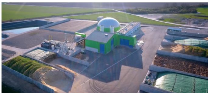
Biogaz d'Arcis (10) - Injection de biométhane 480 Nm 3 CH 4 /h